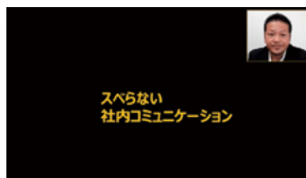
「コミュニケーション」講演会（10月）