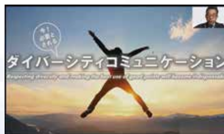
「ダイバーシティ」講演会（3月）